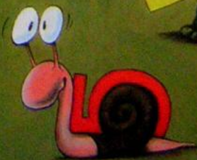
Plakatgröße: 70 cm x 100 cm